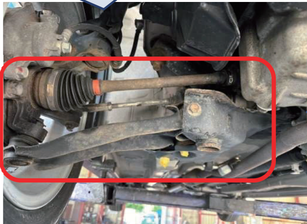
洗浄・黒塗装後の下回りの状態例